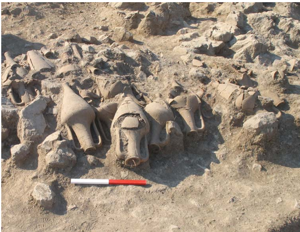
Fig. 1. « Heracleian » amphorae in situ in a tumulus near Apollonia Pontica.

« Heracleian » amphora material is represented at the Bulgarian Black Sea coast with both stray finds and long series from various sites in the Greek colonies and their hinterland. The occurrence of « Heracleian » amphorae (identifiable amphorae or englyphic stamps) is marked by specific peculiarities and has different quantitative volumes in the coastal area and in the Thracian interior. The two authors will discuss the results of studies on englyphic amphora stamps from the Burgas Bay area (from the necropoleis of Apollonia, from Mesambria and from the emporion in the locality Sladkite Kladentsi in Burgas), and also from the internal territories to the south of the Balkan range. The aim is to elaborate on the chronological, distributional and quantitative patterns of the trade involving the use of amphorae with englyphic stamps.