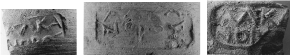
Fig. 1. Alkanor amphoras.