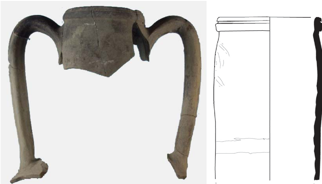
Fig. 2. Grooved rim amphoras, late 2 nd century BC.