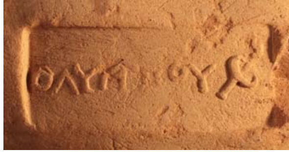
Fig. 1. Rhodian amphora stamp of the fabricant Olympos with a burning torch (out of scale).