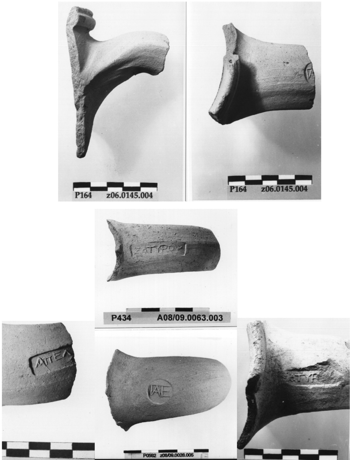
Fig. 3. Stamps from grooved rim amphoras and lagynoi .