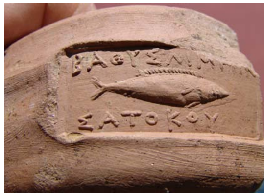
Fig. 1. Timbre de Bathus Limen (hors échelle).

Même si ces timbres proviennent de contextes stratifiés, ils ne peuvent pas être considérés comme ayant une valeur stratigraphique réelle et absolue. En revanche, ils apportent des données importantes sur la prosopographie amphorique et sur les échanges commerciaux entretenus par l'île de Lesbos.