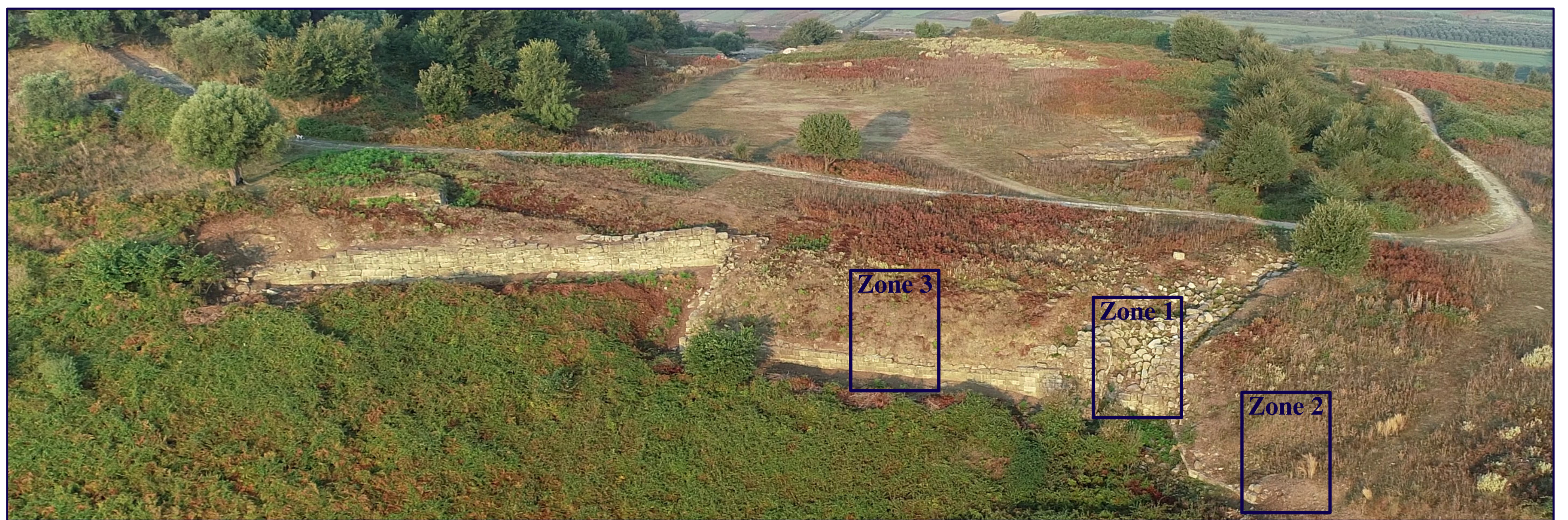
Fig. 2. Vue aérienne de la Porte Nord-Est