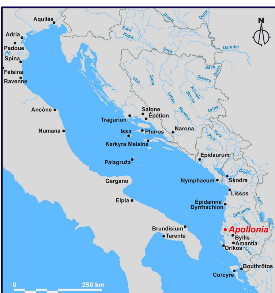
Fig. 1. Carte des cités grecques sur le pourtour de la Mer adriatique (VIII-IIIF s.) © Philippe Lenhardt.