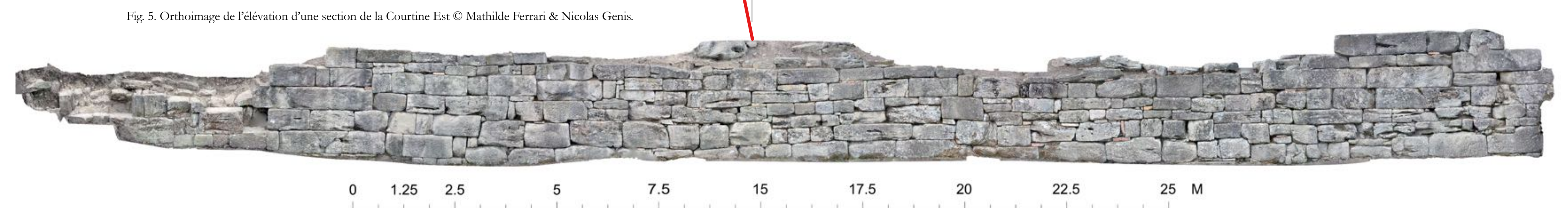
Fig. 5. Orthoimage de l'élevation d'une section de la Courtière Est © Mathilde Ferrari & Nicolas Genis.