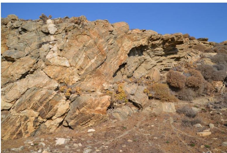
Un front de taille dans une carrière de gneiss

Enfin, l'exposition s'achève autour de la présentation détaillée des quatre édifices évoqués tout au long du parcours. Finement analysés, ils livrent les secrets des roches qui les constituent. Ces résultats ouvrent un large éventail de thématiques et de questions. Comment les Naxiens au VI e s. av. n. è. ont-