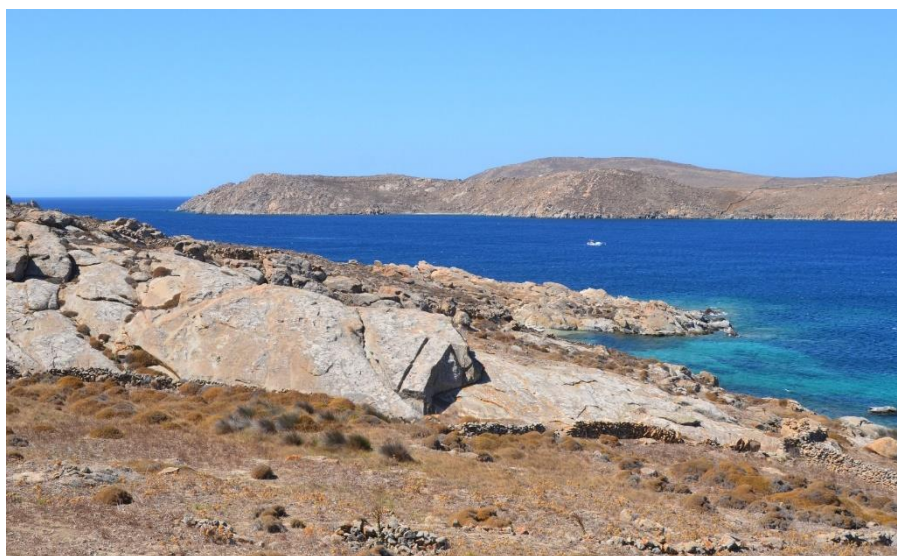
Une carrière de granite dans le sud de Délos, EFA - GAD.