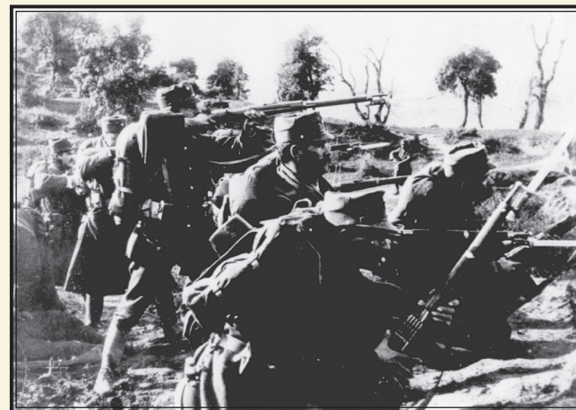
Έλληνες Μαχητές του Α΄ Παγκοσμίου Πολέμου.

13.15 – 13.30: Πέρας εκδήλωσης – Επίδοση αναμνηστικών.